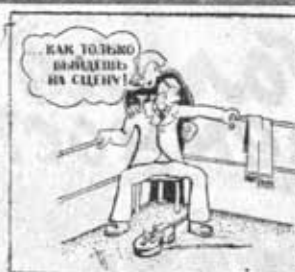
Рисунки Э. Бубовича, И. Сидорова и А. Тришева.