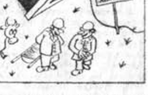
— Утерли все-таки нос этим пизанцам!