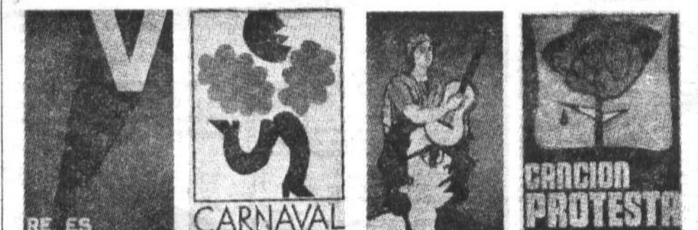
● Перед вами — серия афиш, выпущенных к фестивалю политической песни и маршу в Гаане, и плакат, символизирующий победу кубинской революции.

Каким должен быть, каким может быть политический плакат? Этот вопрос задают себе отрядные художники, готовясь к фестивалю политической песни, к митингам и манифестациям, к конкурсу политического плаката. Сегодня мы очень кратко рассказываем вам о кубинском политическом плакате, плакате с острова Свободы — адреса будущего Всемирного фестиваля молодежи и студентов.