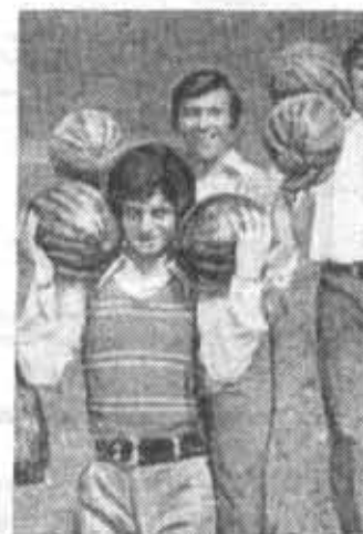
Вот это завхоз!