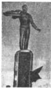
● ЭКСПЕДИЦИЯ В ГОРОД ГАГАРИН