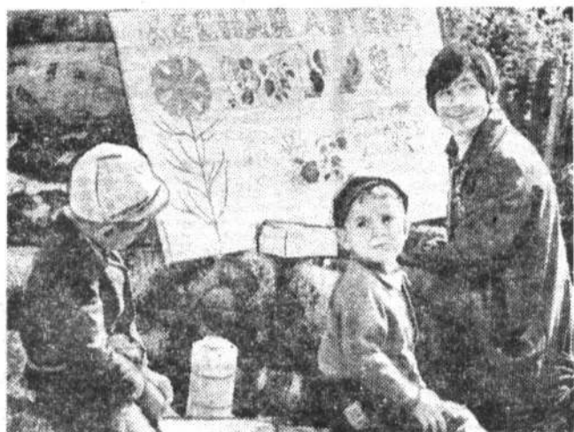
Урок на лесной полянке.