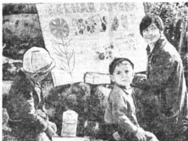
Урок на лесной полянке.

Я, в стороне от хоженых тропинок, Один в лесу блуждаю Здесь под ногами в зелени травинок Кровавым соком ягоды горят. Поспела рано нынче земляника! Она кругом — бесчисленная рать. И у меня забота невелика — Хочу лукошко полное набрать. Она потом вареньем вкусным станет! Сегодня мне привольно и легко, Поскольку гром в мой судьбе не грянет И дома ждет парное молоко.