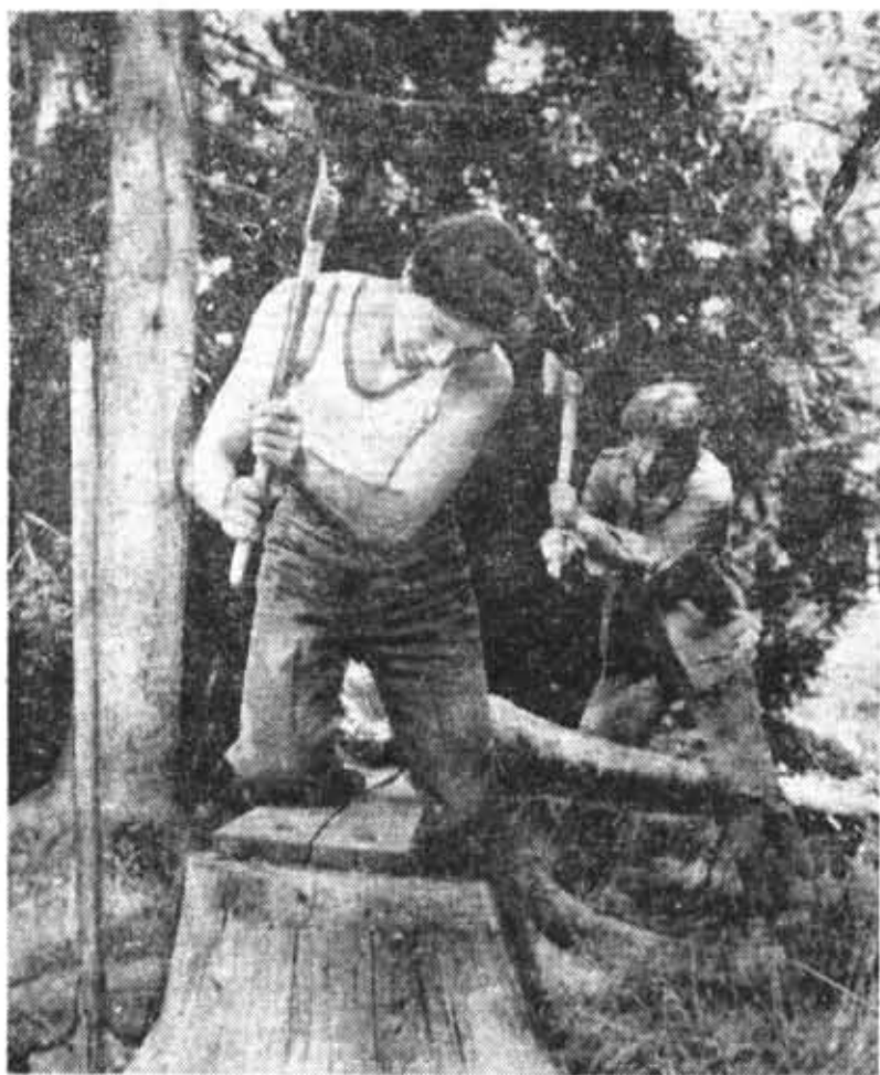
И будет скамейка в лесу.