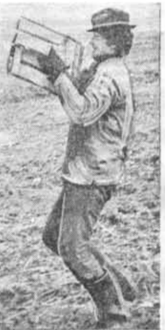
Вперед, без остановок!