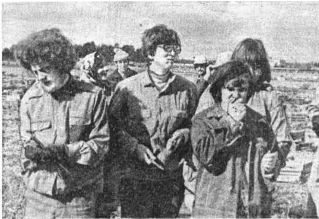
В ЮБИЛЕЙНОЙ ВАХТЕ «60-летию Октября — 60 ударных недель!» участвуют студенты социалистических стран, обучающиеся в Политехническом институте имени М. И. Калинина. «Раз учимся вместе — значит, и работать надо всем вместе», — так решили 45 студентов из ГДР и Вьетнама, работающие вместе с комсомольцами электромеханического и энергомашиностроительного факультетов в совхозе «Красный Октябрь» Всеволожского района.

В. ТЕРЕШИН, комиссар Всеволожского штаба сельхозотрядов