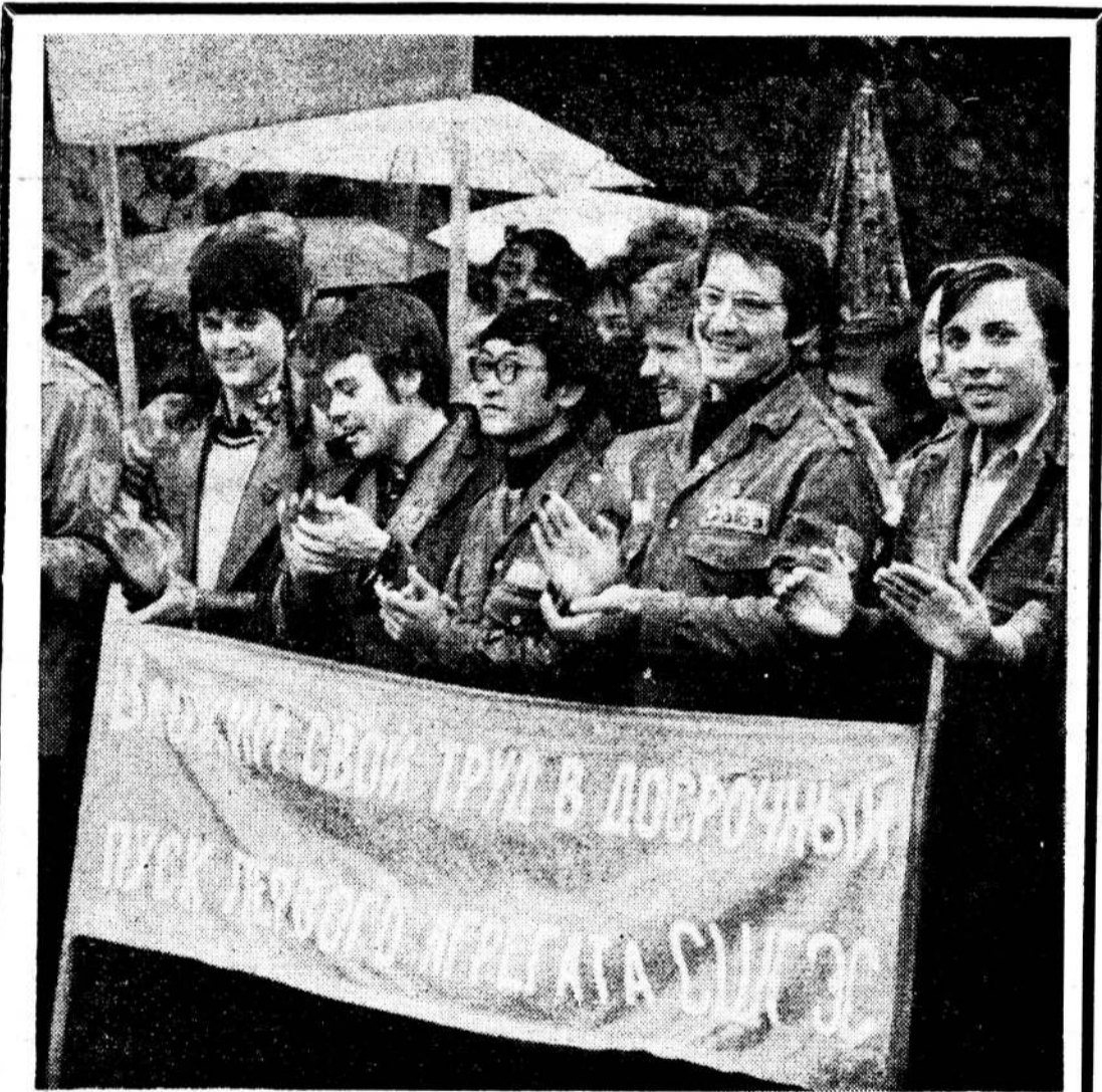
ЭТОТ снимок сделал наш фотокор Сергей Леонов в день торжественного митинга студентов Политехнического института, посвященного отъезду на Саяно-Шушенскую ГЭС. Там, на ГЭС, политехники будут работать на самых главных объектах этой Всесоюзной ударной комсомольской стройки.

В. СПИРИН, главный инженер Объединенного студенческого отряда