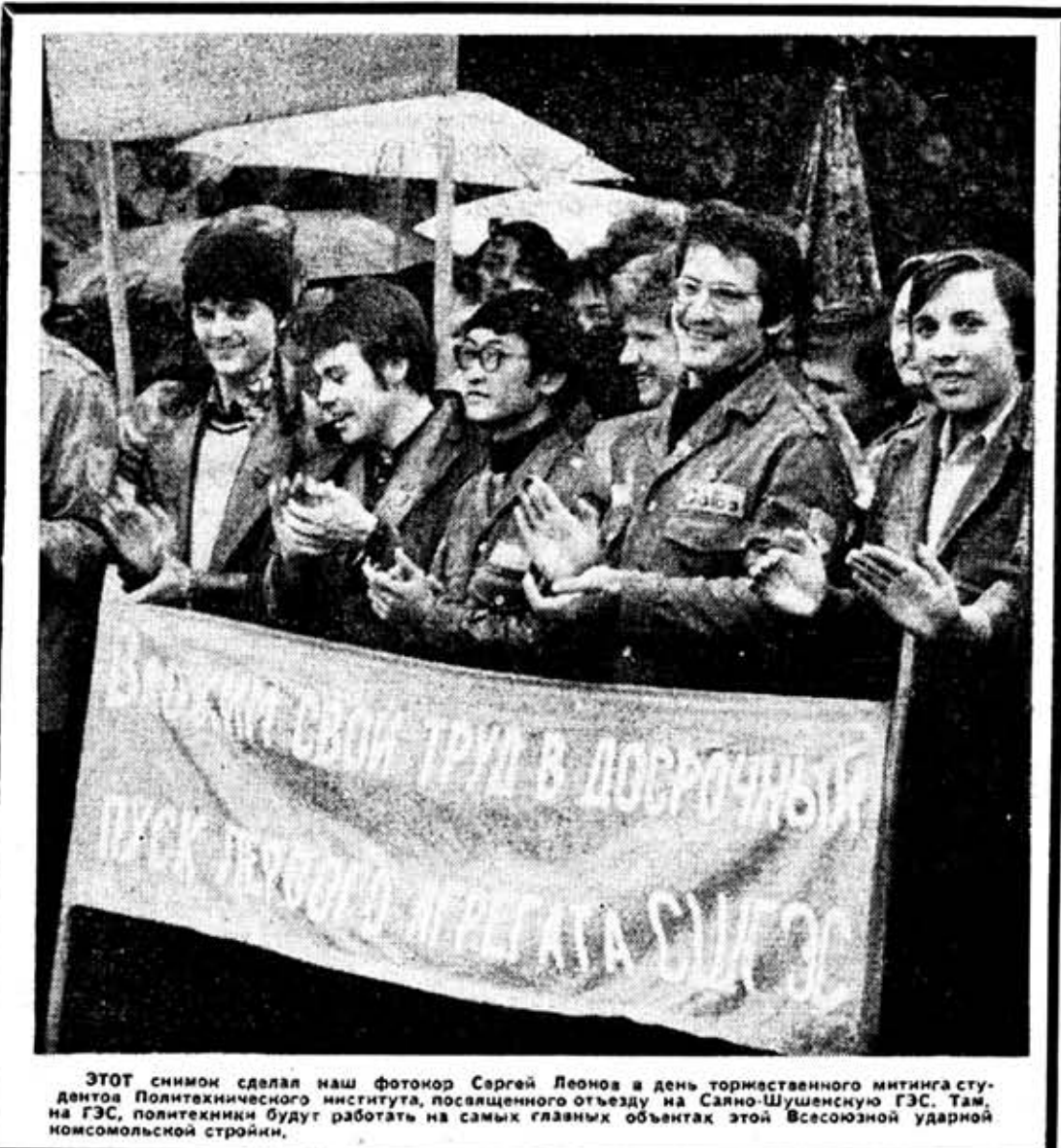
ЭТОТ снимок сделал наш фотокор Сергей Леонов в день торжественного митинга студентов Политехнического института, посвященного отъезду на Саяно-Шушенскую ГЭС. Там, на ГЭС, политехники будут работать на самых главных объектах этой Всесоюзной ударной комсомольской стройки.

В. СПИРИН, главный инженер Объединенного студенческого отряда