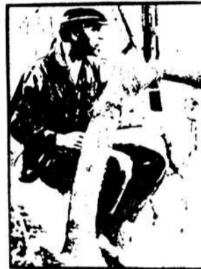
ОСВАЛЬДО ОРТЕГА НЕХМЕ

Еще одна черта личности Че — углубленно заниматься исследованиями в области общественных наук, политики и философии — постоянно отличала его даже тогда, когда многообразие обязанностей президента национального банка, а позже — министра промышленности, казалось, без остатка зани-