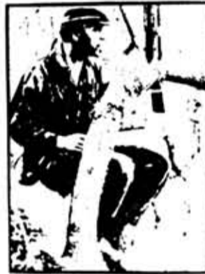
ОСВАЛЬДО ОРТЕГА НЕХМЕ