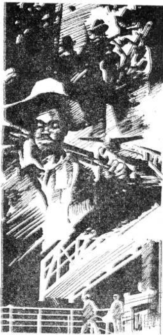
Он молча инанул, задумался...