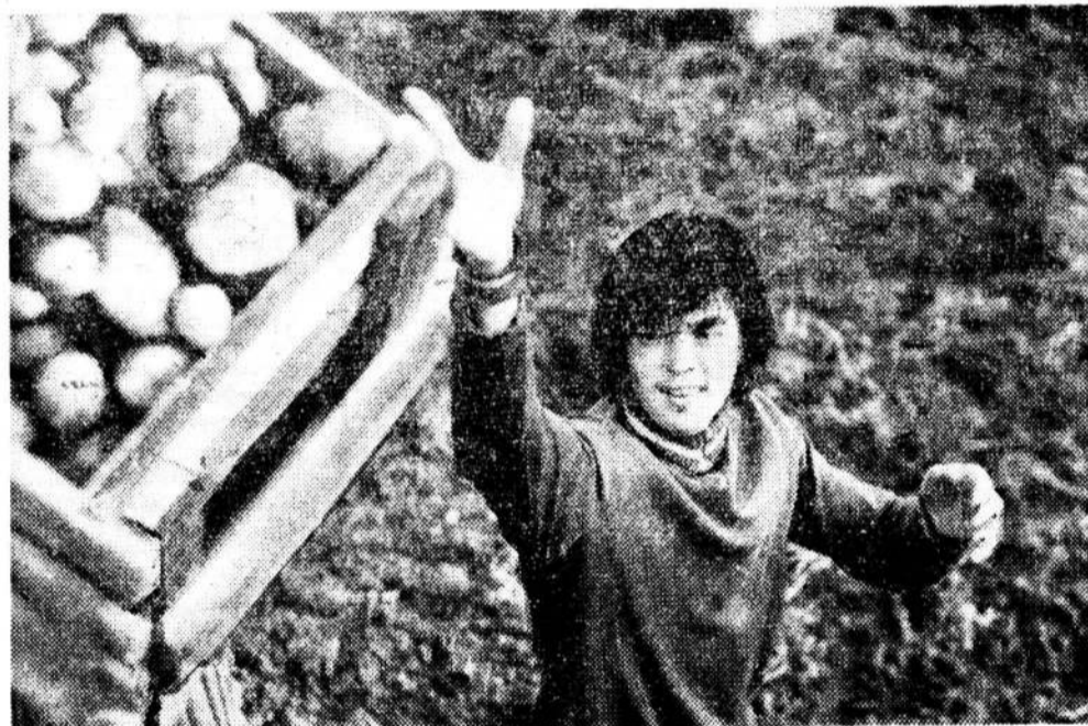
Перед вами — бригада механического факультета Института киноинженеров, занявшая первое место по итогам восьмой недели соревнования, объявленного «Сменной»-студенческой в начале трудового семестра.

Бригада работает на уборке картофеля в совхозе «Сельцо» Волоцкого района Ленинградской области.