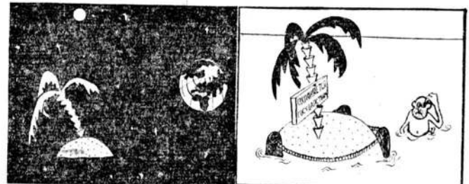
● НАМ НАРИСОВАЛА М. БОНДАРЕНКО