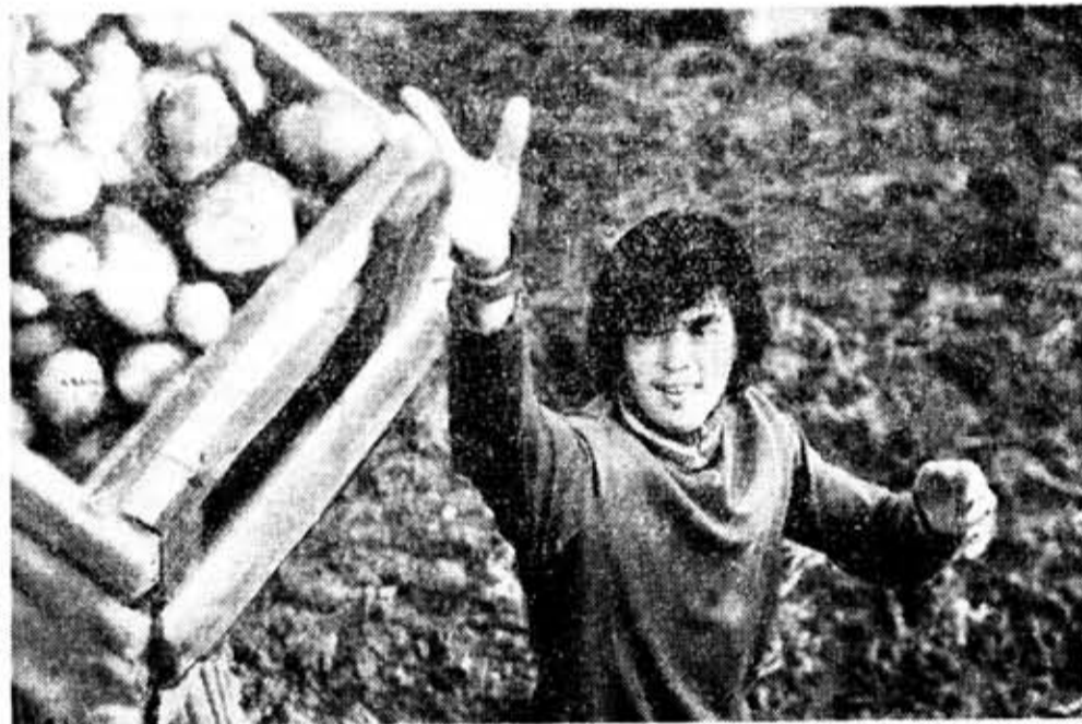
Перед вами — бригада механического факультета Института киноинженеров, занявшая первое место по итогам восьмой недели соревнования, объявленного «Сменной-студенческой» в начале трудового семестра.

Бригада работает на уборке картофеля в совхозе «Сельцо» Волосовского района Ленинградской области.