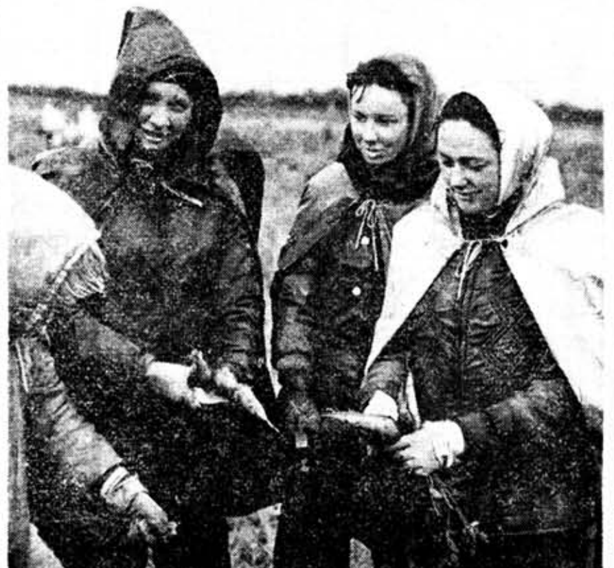
Студентки ЛИИЖТа — на уборке моркови.