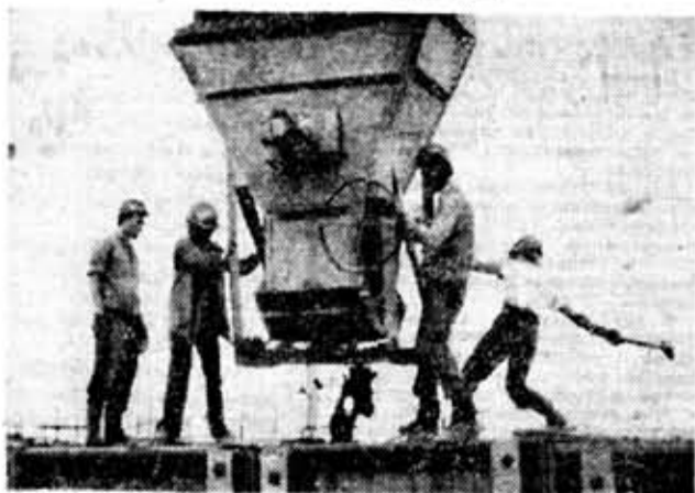
СТУДЕНТЫ Политехнического института — бойцы отряда «Ленинград» укладывают 15-тысячный кубометр бетона у плотины Саяно-Шушенской ГЭС.