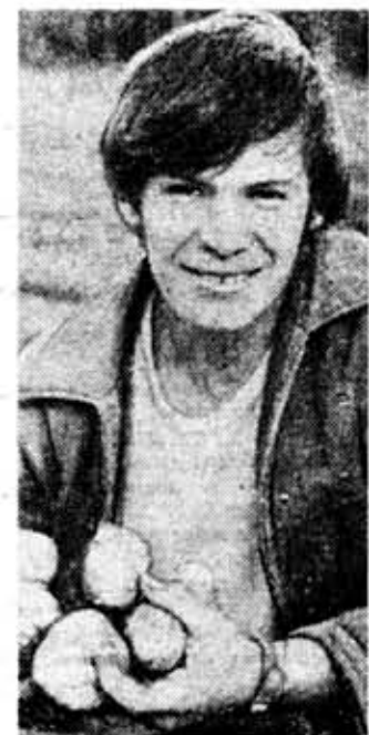
Ах, картошка!