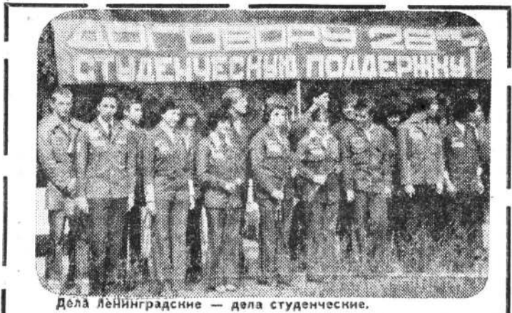
Дела Ленинградские — дела студенческие.

ПРОТИВ БЕДЫ, ПРОТИВ ВОЙНЫ! Взволнованные отклики ленинградских студентов — представителей Кубы, ГДР, Анголы, Вьетнама, СССР, поддерживающих Договор об ограничении стратегических вооружений — ОСВ-2, читайте на третьей странице.