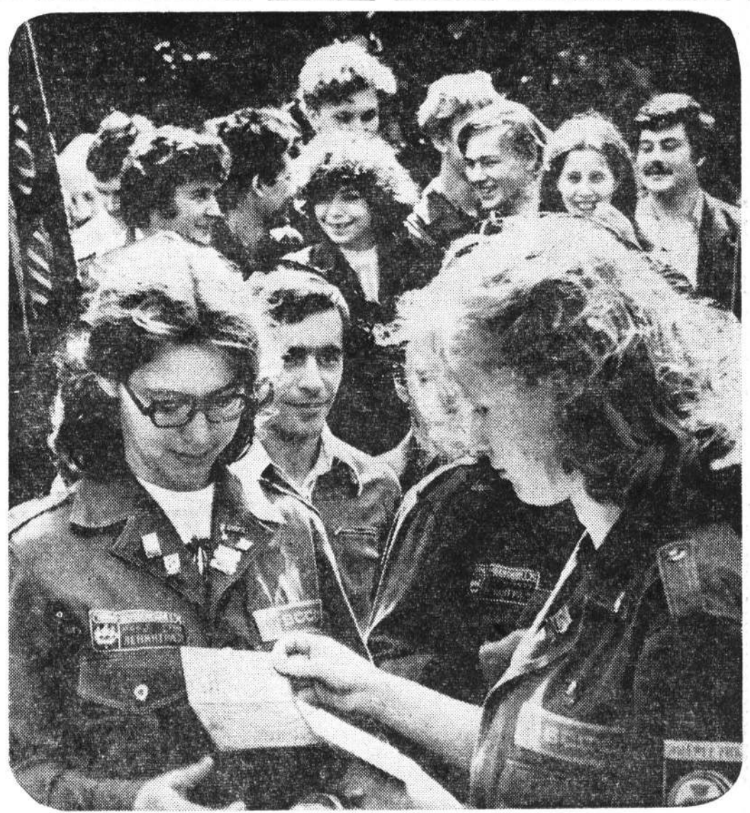
Комсомольская путевка — символ эстафеты, принимаемой стройотрядовцем 1979 года.