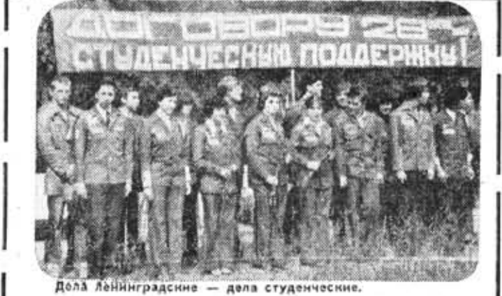
Дела ленинградские — дела студенческие.

ПРОТИВ БЕДЫ, ПРОТИВ ВОЙНЫ! Взволнованные отклики ленинградских студентов — представителей Кубы, ГДР, Анголы, Вьетнама, СССР, поддерживающих Договор об ограничении стратегических вооружений — ОСВ-2, читайте на третьей странице.