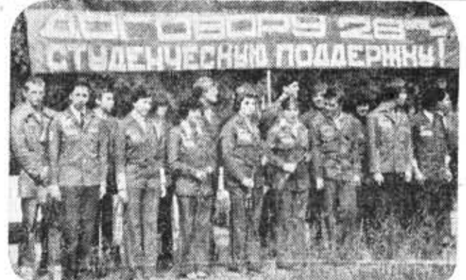
Дела ленинградские — дела студенческие.

ПРОТИВ БЕДЫ, ПРОТИВ ВОЙНЫ! Взволнованные отклики ленинградских студентов — представителей Кубы, ГДР, Анголы, Вьетнама, СССР, поддерживающих Договор об ограничении стратегических вооружений — ОСВ-2, читайте на третьей странице.