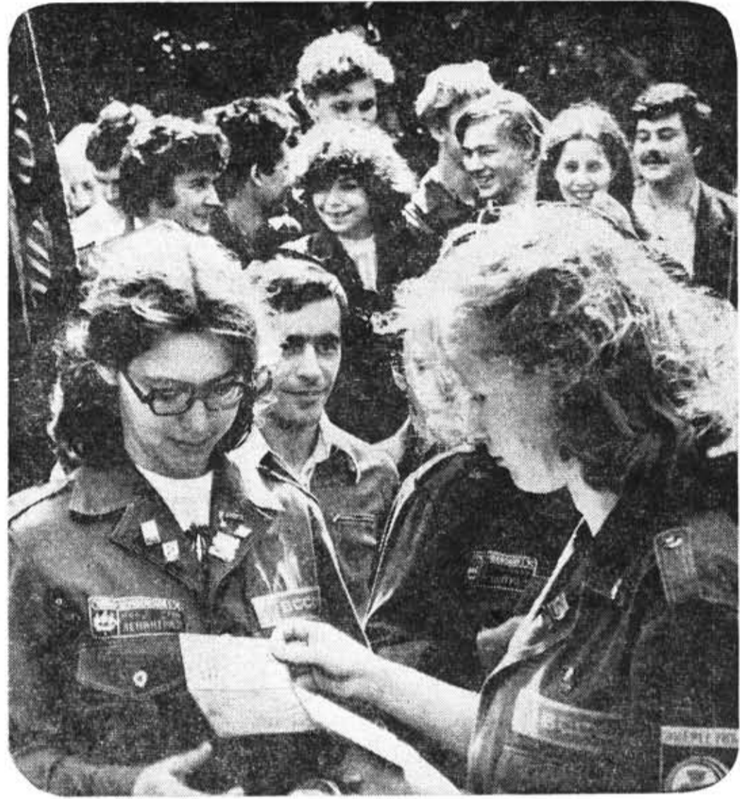
Комсомольская путевка — символ эстафеты, принимаемой стройотрядовцем 1979 года.