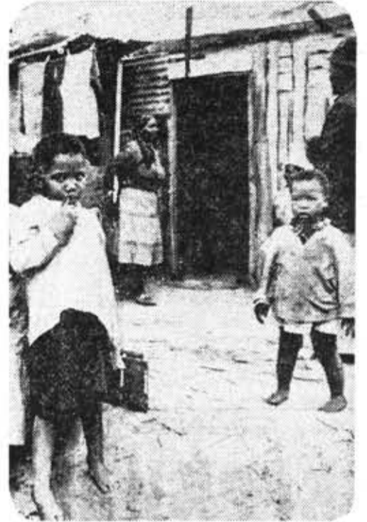
Дети ЮАР.

Мы должны показать путь, по которому надо идти, чтобы обеспечить мирное и счастливое детство. Надо больше строить детских садов, интернациональных пионерских лагерей. Дети — начало мира. Пусть мир для них будет добрым, чтобы каждый малыш бежал к нам, протягивая ручки со словами: