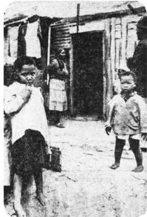
Дети ЮАР.

Что сделано в Венгрии для детей? Очень много. Это и бесплатное образование, медицинская помощь, детские сады и вся, это и оплачиваемый от-