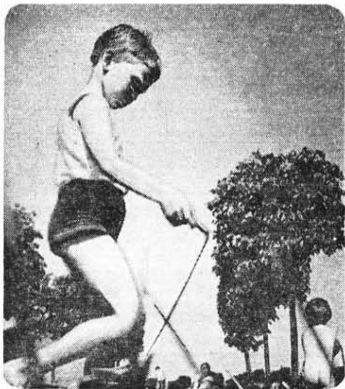
«Все выше и выше...»