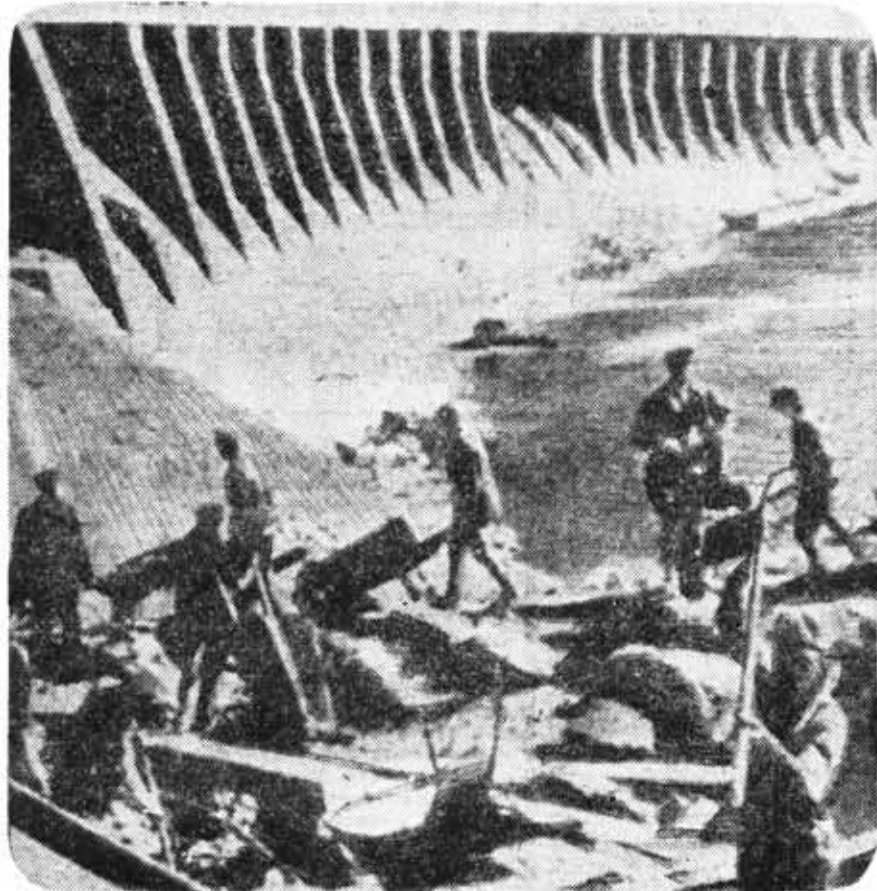
Так советские люди восстанавливали Днепровгэс, разрушенный фашистами во время войны.