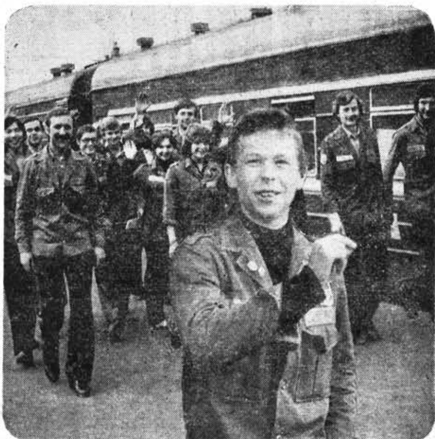
20 августа в Ленинград из Днепропетровска возвратились представители бригад — победителей конкурса «Претендент-79».