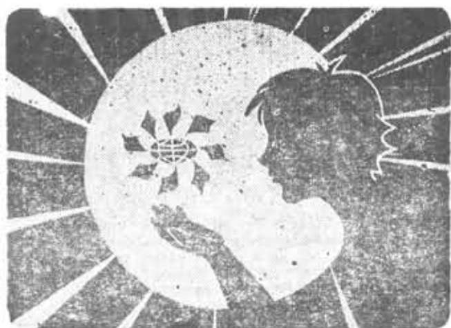
«Солнца вам, дети!» — плакат Елены Лопатиной из отряда «Колос» Технологического института.