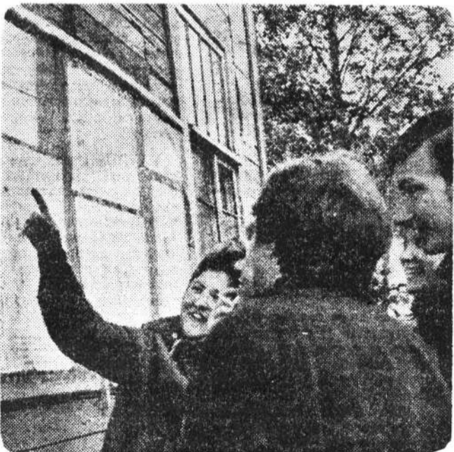
Ежедневно, а иногда даже по несколько раз в день, в лагере отряда проводятся новые выпуски этой популярной студенческой газеты.