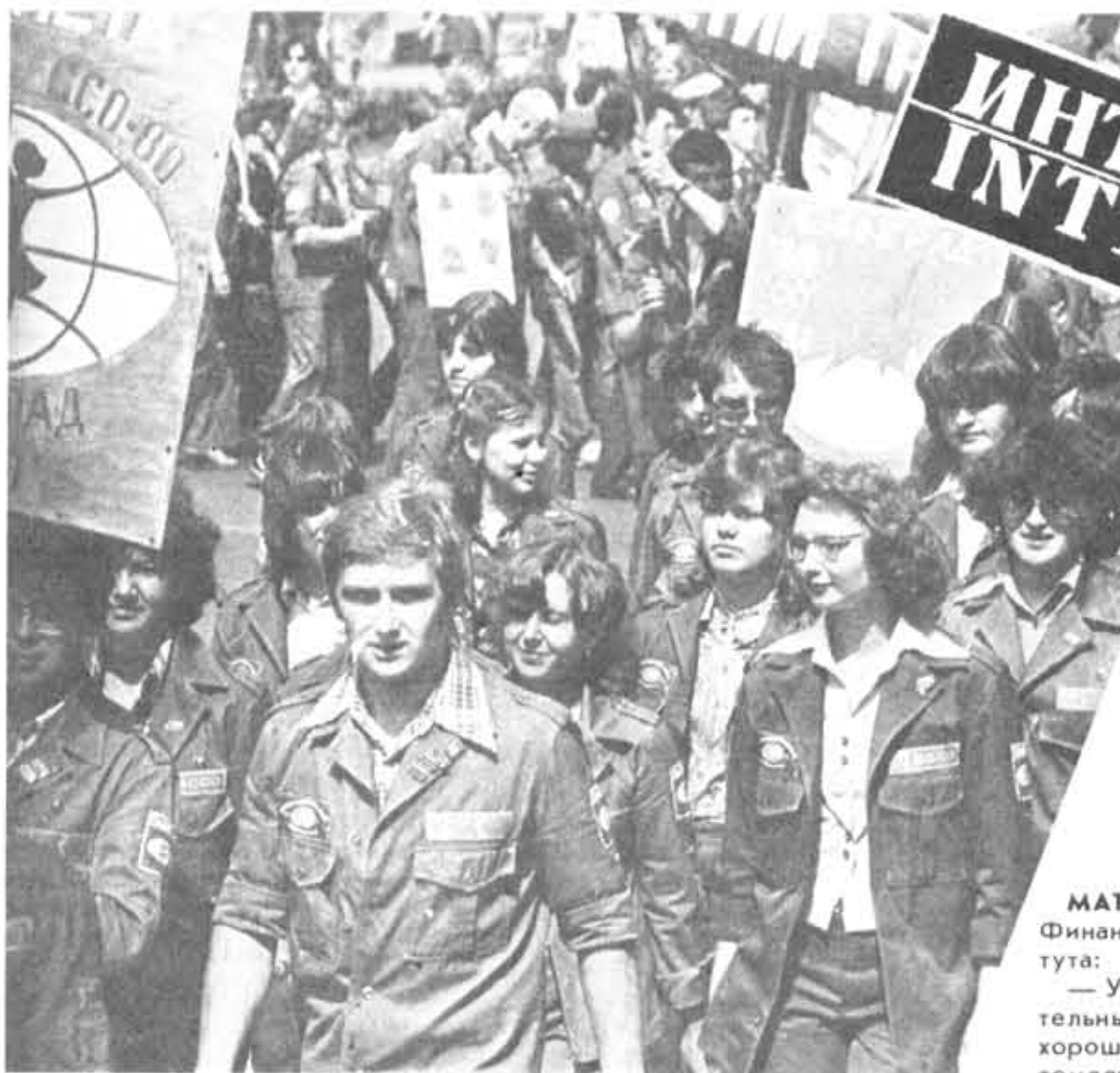
На снимке: бойцы ЗСО «Интернациональный».