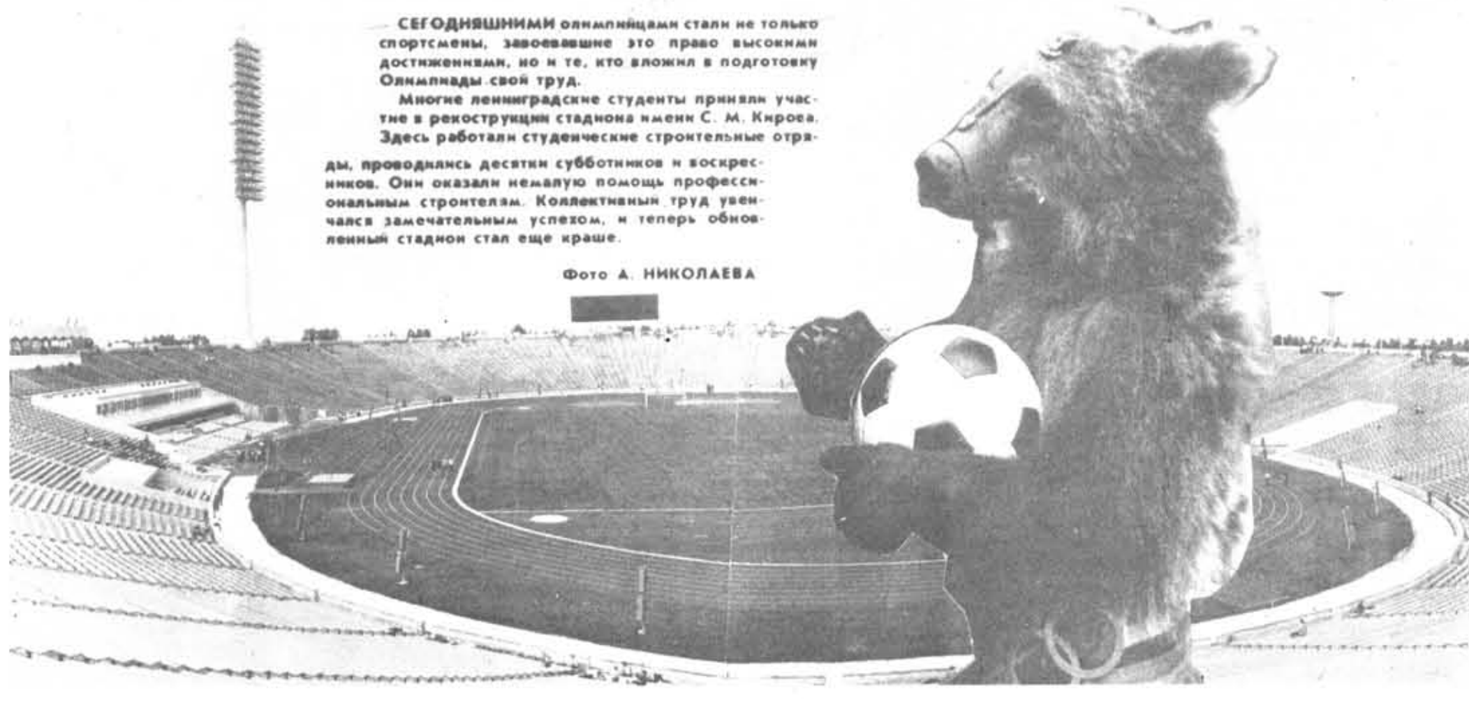
СЕГОДНЯШНИМИ олимпийцами стали не только спортсмены, завоевавшие это право высокими достижениями, но и те, кто вложил в подготовку Олимпиады свой труд. Многие ленинградские студенты приняли участие в реконструкции стадиона имени С. М. Кирова. Здесь работали студенческие строительные отряды, проводились десятки субботников и воскресников. Они оказали немалую помощь профессиональным строителям. Коллективный труд увенчался замечательным успехом, и теперь обновленный стадион стал еще краше.

Вечер студенческих отрядов «Рампа» и ансамбля выступила театра, музыки и кинематографии принял участие в «Марше мира и дружбы». Они обратились с письмом к президенту США. Господи! Президент! Сегодня день печаль, радио и телевидение передают тревожные известия о том, что в районе Западной Европы ведется подготовка к запуску нового американского ракетного носителя. Сегодня над мирным небом и хотим, чтобы над мирным небом — чистое и голубое, было над миром — «арадами». Так против кого вы хотите нацелить свои ракеты, г-н Президент! Сегодня играть с огнем, г-н Президент! Мы не понимаем, что, разжигая войну между странами, нельзя защитить от войны и свое собственное небо! Подпись — 33 подписей. С. МИХАЙЛОВА, комиссар отряда «Маска»