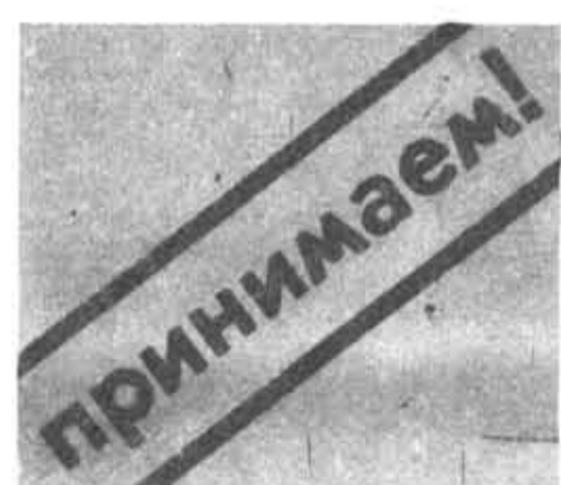
Материалы Переключки подготовил к печати И. ИВАНОВ

Ему и другим воинам, павшим в бою у Невской Дубровки, жителями поселка поставлен памятник. Бойцы «Ладог-8» взяли над ним шефство.