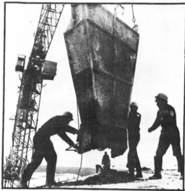
Хорошо работают бойцы студенческого строительного отряда «Солнечный» Электротехнического института. Они участвуют в возведении нового цеха завода керамических плиток в селе Никольском Ленинградской области. На снимке: идет прием бетона.

МАТЕРИАЛЫ ПЕРЕКЛИЧКИ ПОДГОТОВИЛ К ПЕЧАТИ И. ИВАНОВ