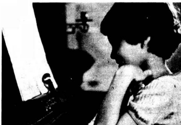
● Ожидание музыки...