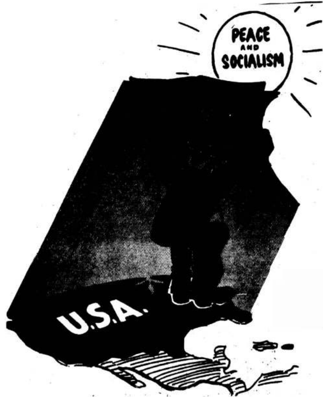
Рис. из зарубежной печати

● Попытки буржуазной пропаганды оклеветать завоевания социализма терпят неминуемый крах.