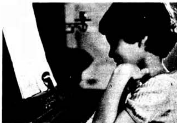
● Ожидание музыки...

С. КУРМАШЕВ, комиссар РСО «Лодейнопольский»