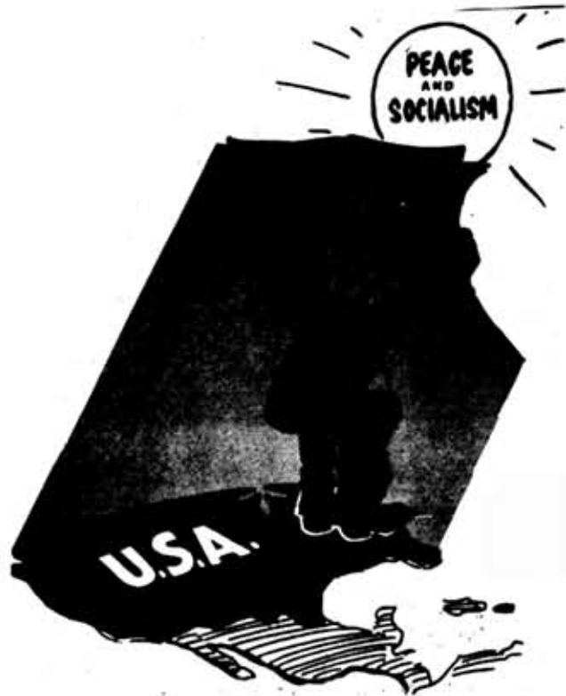
Рис. из зарубежной печати

● Попытки буржуазной пропаганды оклеветать завоевания социализма терпят неминуемый крах.