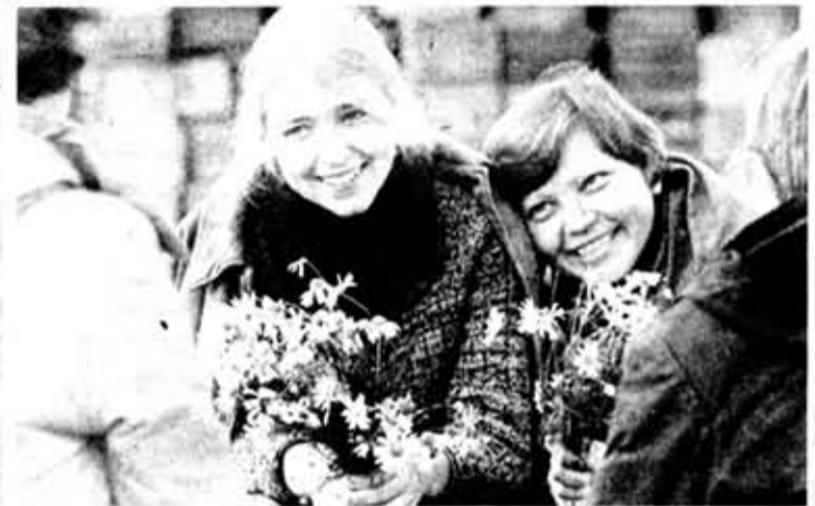
● Осенние ромашки.