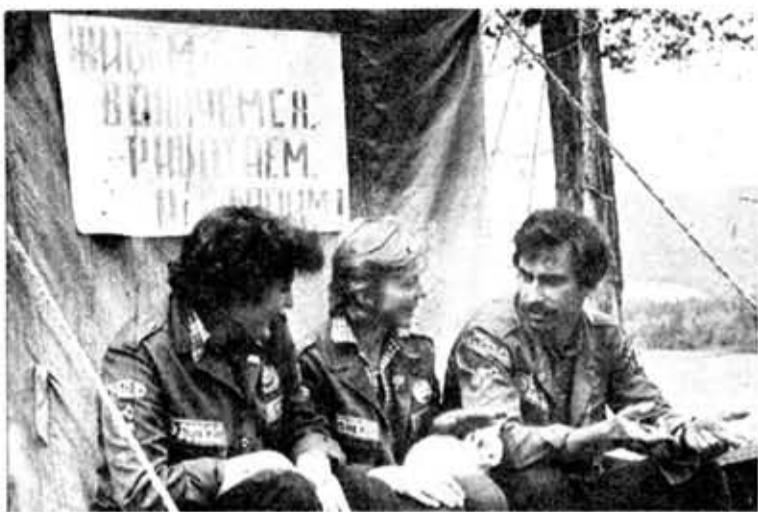
● ОТРЯД НА БАМЕ