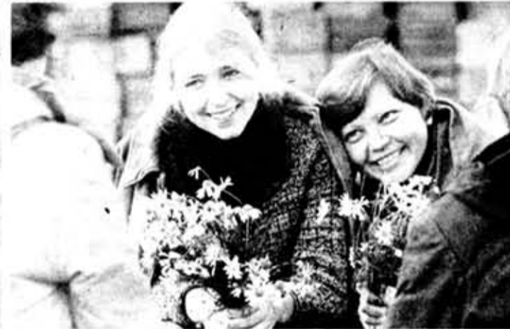
● Осенние ромашки.