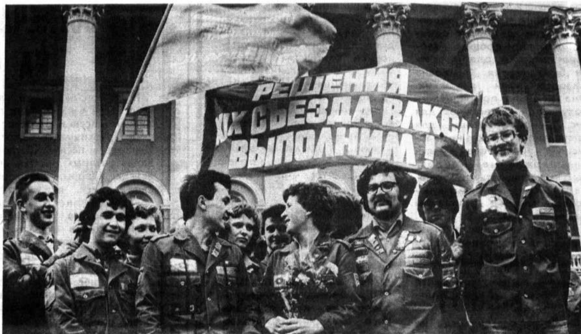
● Бойцам зонального студенческого отряда «Интернациональный» предстоит этим летом трудиться в Ставропольском крае.