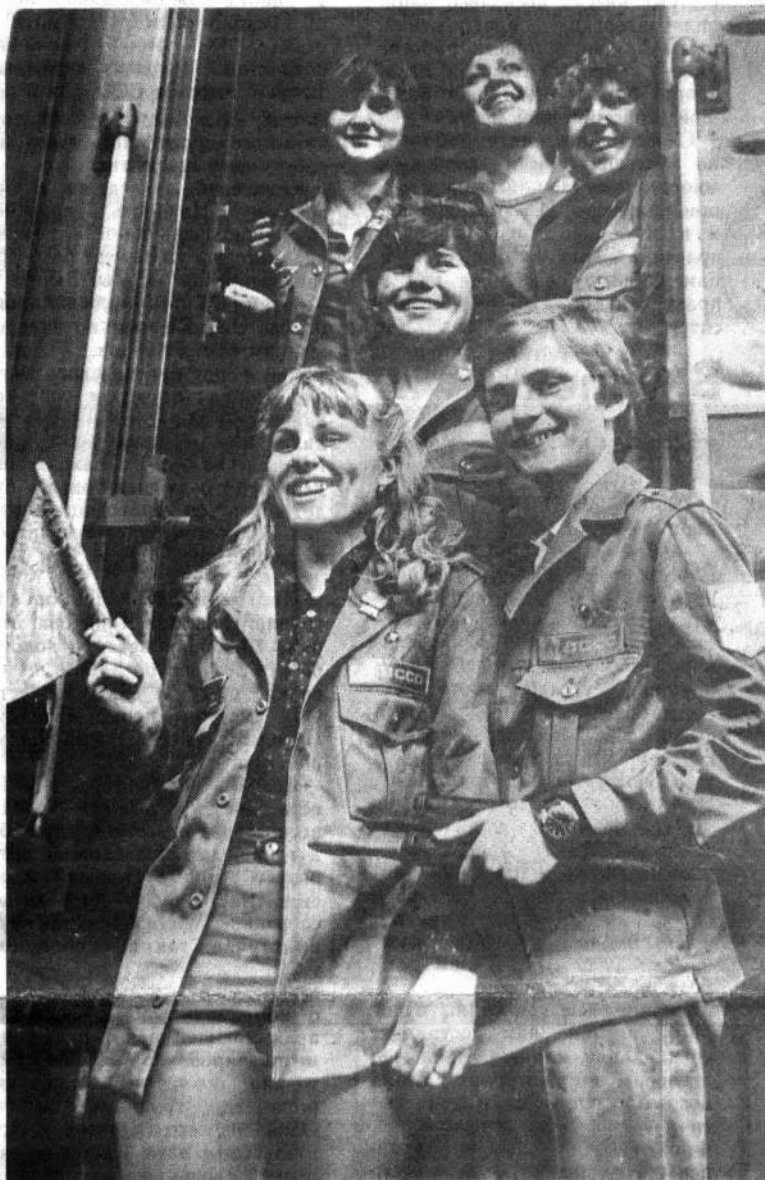
Для поездной бригады «Экспресс-1» Института инженеров железнодорожного транспорта имени академика В. Н. Образцова из районного отряда «ВЧ-8» лето началось с рейса на Мурманск.

По-прежнему в центре внимания бойцов ССО остаются операции «Пусть всегда будет солнце!», «Летопись Великой Отечественной», рейд «Природа».