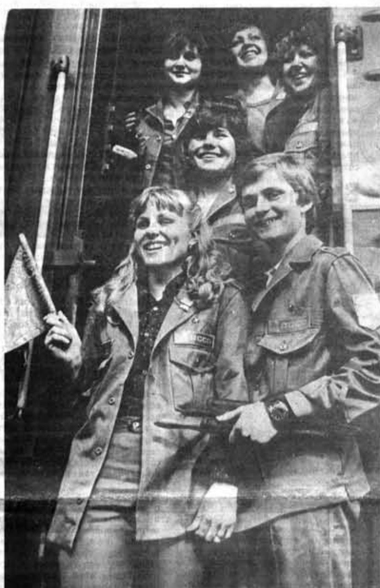
Для поездной бригады «Экспресс-1» Института инженеров железнодорожного транспорта имени академика В. И. Образцова из районного отряда «ВЧ-8» лето началось с рейса на Мурманск. Это трудовое лето для бойцов бригады — первое. Своим железнодорожным семестром они решили провести все вместе — студенты одной группы с электротехнического факультета ЛИИЖТа.

По-прежнему в центре внимания бойцов ССО остаются операции «Пусть всегда будет солнце!», «Летописи Великой Отечественной», рейд «Природа».