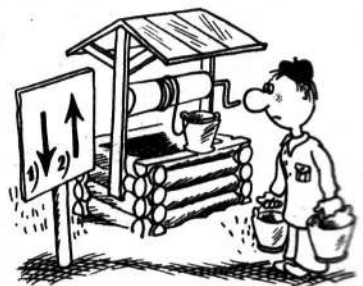
Рис. В. Милейко