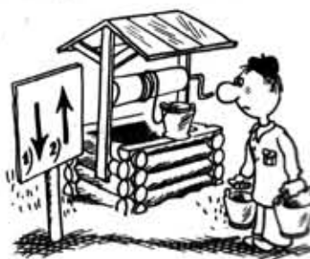
Рис. В. Милейко