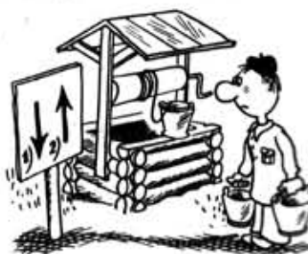
Рис. В. Милейко