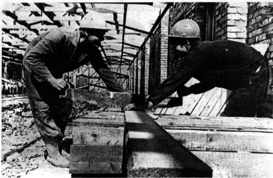
● ШКОЛА ЛЕКТОРА ● ШКОЛА ЛЕКТОРА ● ШКОЛА ЛЕКТОРА