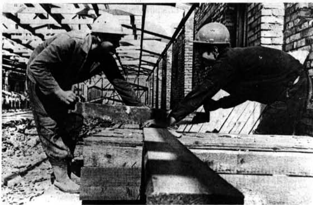
● ШКОЛА ЛЕКТОРА ● ШКОЛА ЛЕКТОРА ● ШКОЛА ЛЕКТОРА