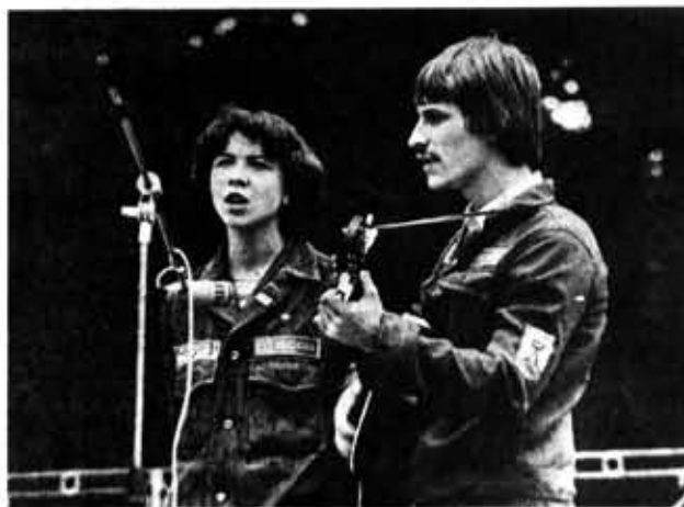
На снимках: Идет митинг в ЗСО «Приморский»