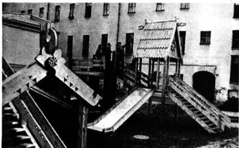
Еще одной детской игровой площадкой, построенной руками бойцов студенческих отрядов, стало больше. Ее адрес — улица Чайковского, 6. Построили эту площадку бойцы отряда «Этюд» Высшего художественно-промышленного училища имени В. И. Мухоморова (ЗСО «Центральный»).