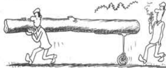
Рис. В. Милейко