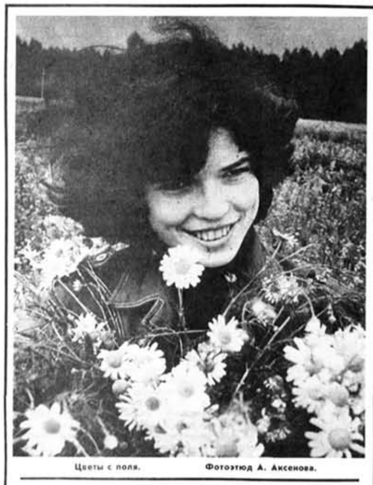
Цветы с поля.

Закончился трудовой семестр. Подводятся итоги летней работы. Как всегда, лучший опыт получит распространение в дальнейшем. Но студенты думают сегодня и о том, как избежать в будущем тех проблем, с которыми они столкнулись нынче. А значит, будет сделан новый шаг в организации студенческой стройки.