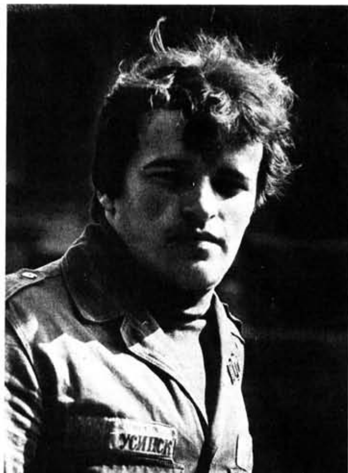
● ОТРЯД В ЛИЦАХ