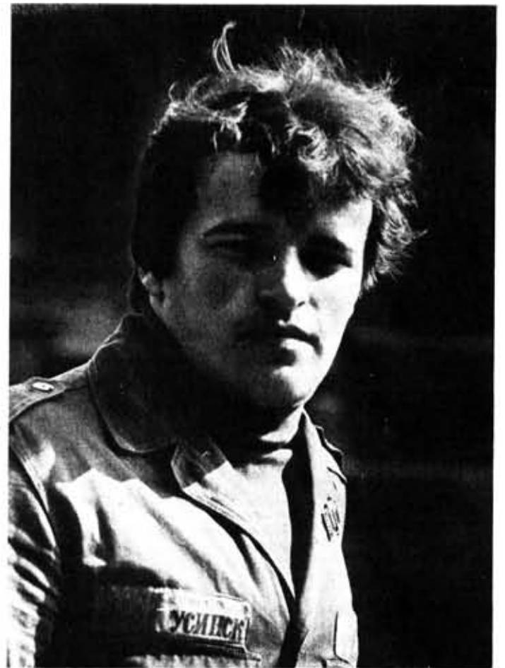
● ОТРЯД В ЛИЦАХ