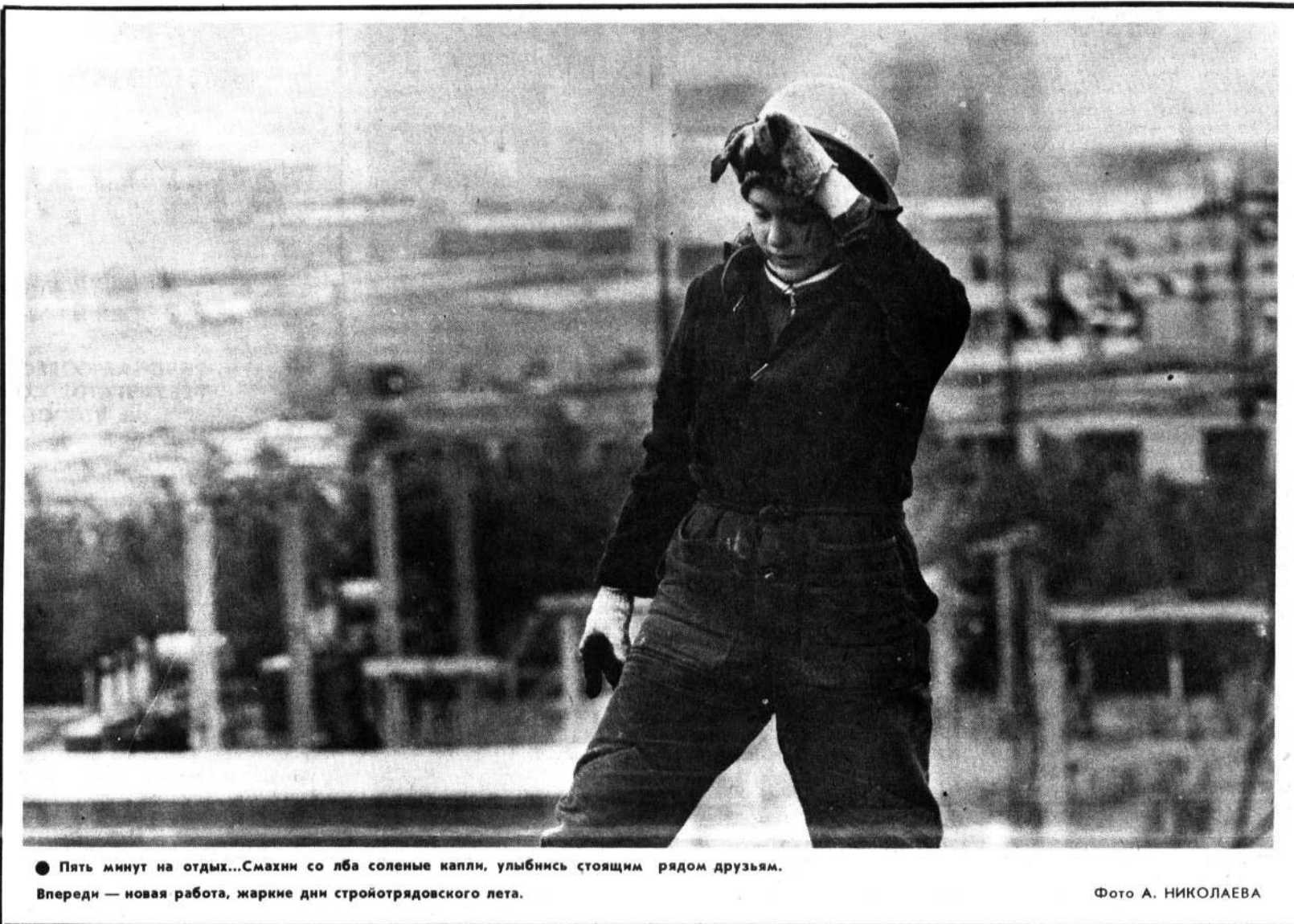
● Пять минут на отдых...Смахни со лба соленые капли, улыбнись стоящим рядом друзьям. Впереди — новая работа, жаркие дни стройотрядовского лета.

Этим летом «Юстус» строит узкоколейную железную дорогу в поселке Трент Княжпогостского района Коми АССР. Один пункт социалистических обязательств, принятых отрядом, — выполнение производственного договора на сто тысяч рублей. Думаю, в ходе работы мы примем новые, более напряженные, с учетом резервов повышения производительности труда. «Юстус» — отряд дружных. Его бойцы настроены на труд добросовестный, с полной отдачей сил. Сдержанное комсомольское слово — наше общее желание.