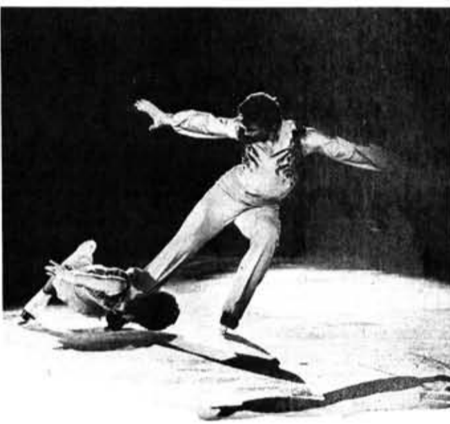
● В зале — только музыка, зрители и они — художники, мастера, актеры. Каждый их танец — полет вдохновения и огромная самоотдача. На льду — Елена Валова и Олег Васильев.