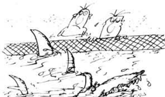
Рис. М. Стрельцова

Купание разрешается ТОЛЬКО В ОГРАЖДЕННЫХ МЕСТАХ.